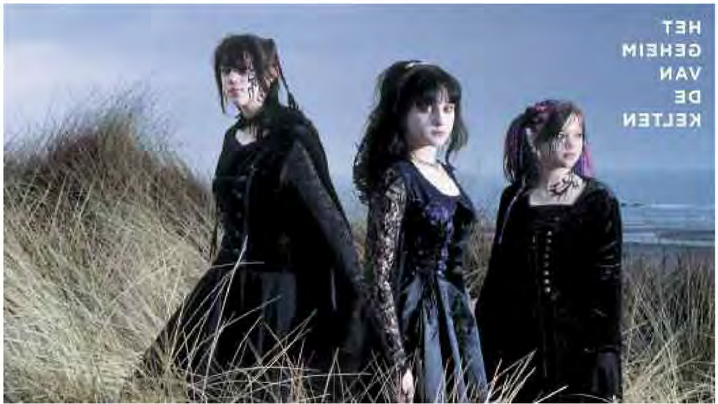
2 ›Das Geheimnis der Kelten‹, Limburgs Museum Venlo.