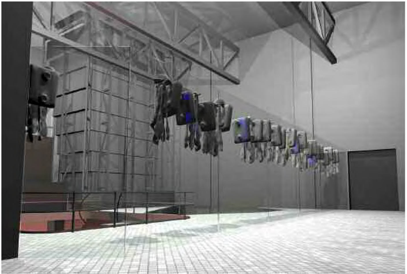
8 Eine Anwendung von AR.