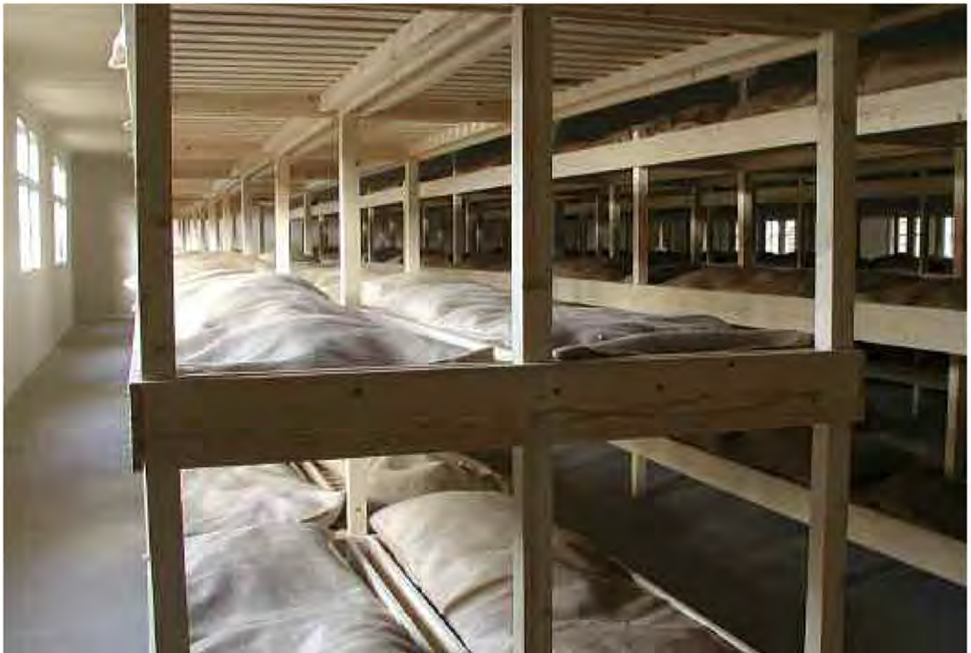
6 Die Baracke im Nationaldenkmal.

›anzugreifen‹. Dazu verwendeten wir die Technik ›Augmented Reality‹, was wörtlich ›zugenomene Wirklichkeit‹ bedeutet. Mit dieser Technik kann das Bild, das ein Beobachter von seiner Umgebung hat, um zusätzliche Informationen ergänzt werden. Mit dem aufgenommenen Bild einer Kamera können bestimmte visuelle Merkmale eines Raums erkannt werden. So kann bestimmt werden, wo man sich in einem Raum befindet. Durch die Kombination der Umgebungsbilder mit Bildern einer parallel laufenden virtuellen Umgebung entsteht eine Mischung von real und virtuell. In der virtuellen Schicht können wir anschließend zusätzliche Informationen zur bestehenden Wirklichkeit hinzufügen. Die Besucher des unterirdischen Schachts können sich jetzt durch die Wände die Vergangenheit und den Bergbauprozess anschauen, den historischen Figuren begegnen und dreidimensionale Objekte erfahren. Dies sind inhaltliche Hinzufügungen, die kein Besucher mit der Wirklichkeit verwechseln wird. Authentizität und Informationen sind getrennt.